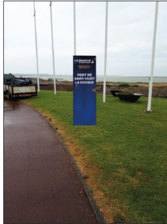
2 - Derrière la capitainerie ou habillage de la capitainerie