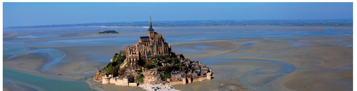
De Cherbourg-en-Cotentin au Mont-Saint-Michel, le Département agit pour tous les Manchois.