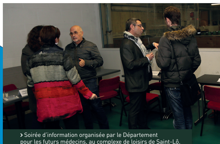
> Soirée d'information organisée par le Département pour les futurs médecins, au complexe de loisirs de Saint-Lô.

> Retrouvez les projets sur tourdefrance-manche.fr (la totalité sera en ligne fin avril)