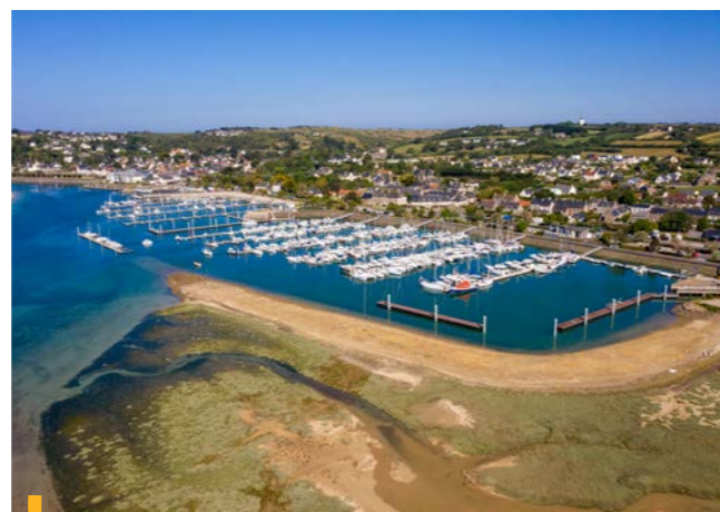
Le port après travaux