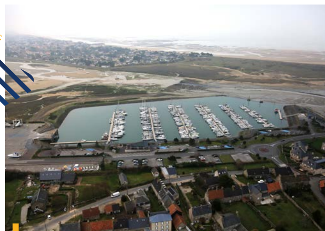
Le port avant travaux

Ce projet, largement plébiscité lors de l'enquête publique, est un véritable atout de développement pour Barneville-Carteret. Il reste toutefois raisonnable tant du point de vue du nombre de places créées que de la prise en compte de l'environnement du port.