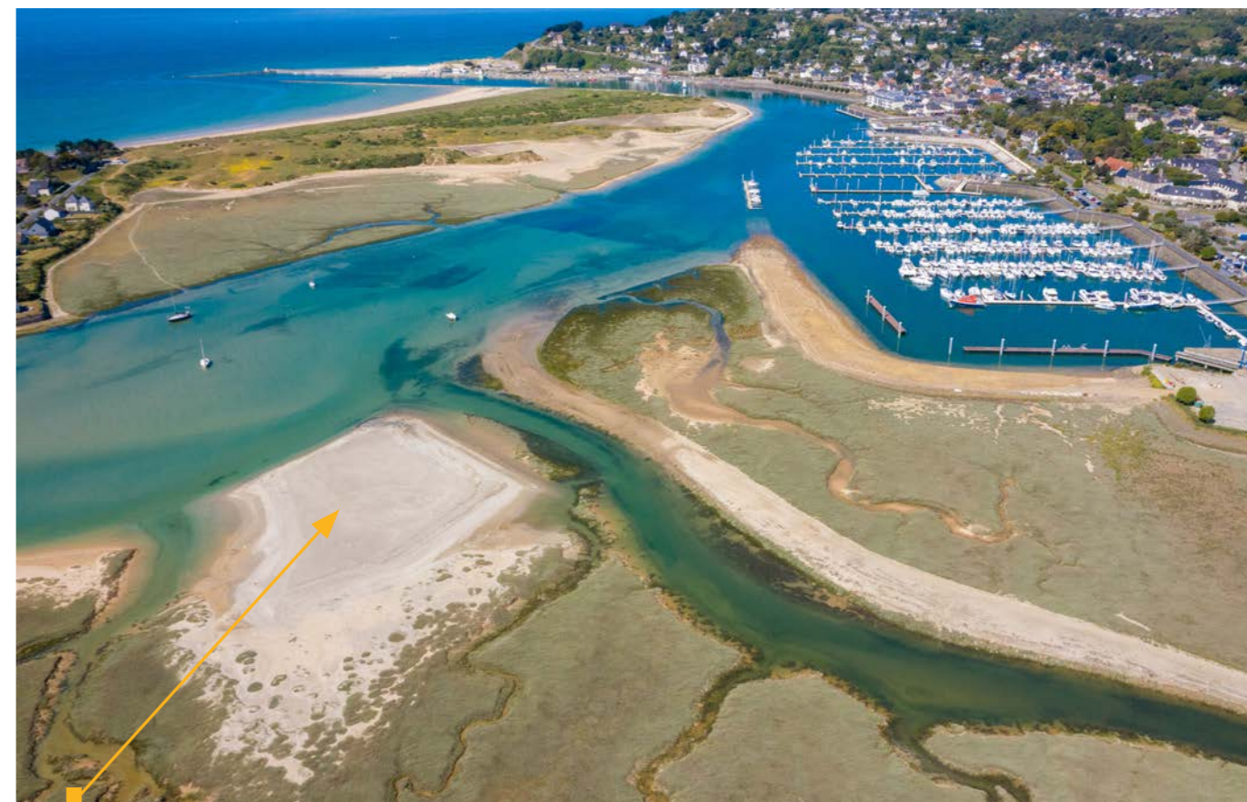
Reposoir à oiseaux migrateurs

Un des enjeux de ce projet raisonné concernait bien évidemment la prise en compte de l'environnement naturel et patrimonial exceptionnel du havre de Barneville-Carteret.