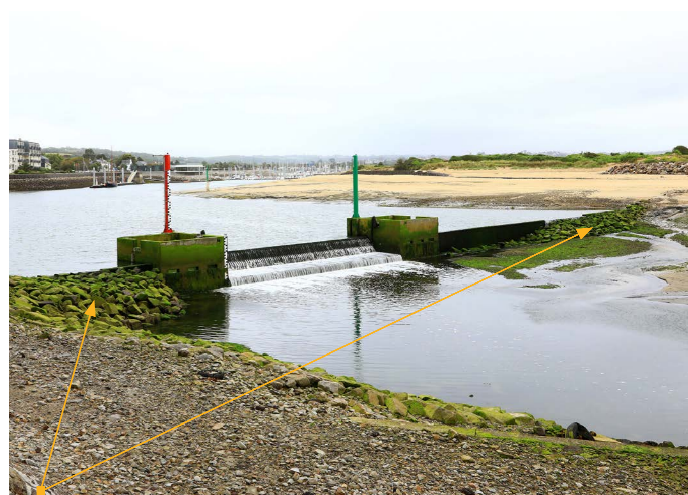
Rampes de remontée piscicole