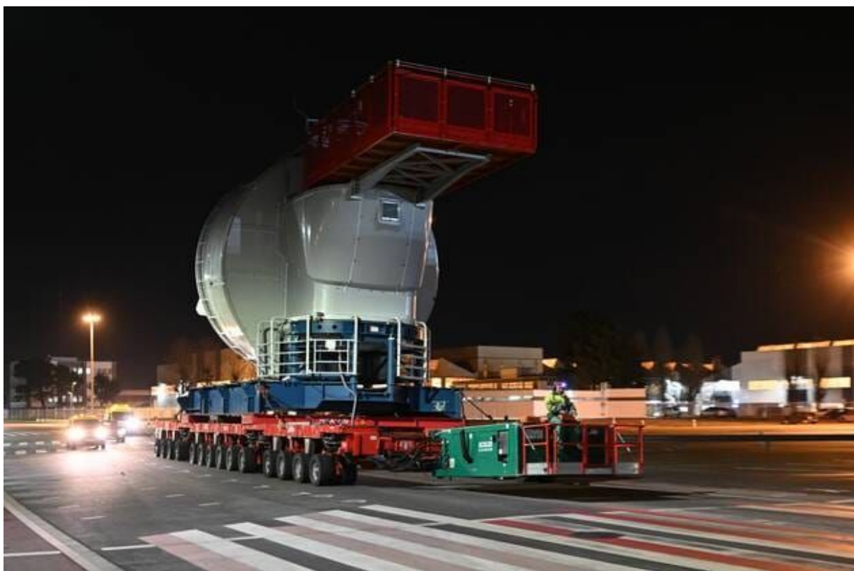
La lourde et imposante nacelle a mis plus de cinq heures à rejoindre le Hub éolien près de la forme Joubert. Les trajets suivants se feront en deux heures environ.

Ce colis lourd de quelque 400 tonnes a pris la route vers 18 h, pour arriver sur zone près de cinq heures plus tard. Elle doit maintenant subir des tests de connexion avec l'E-Stack, le transformateur installé dans le mât de chaque éolienne.