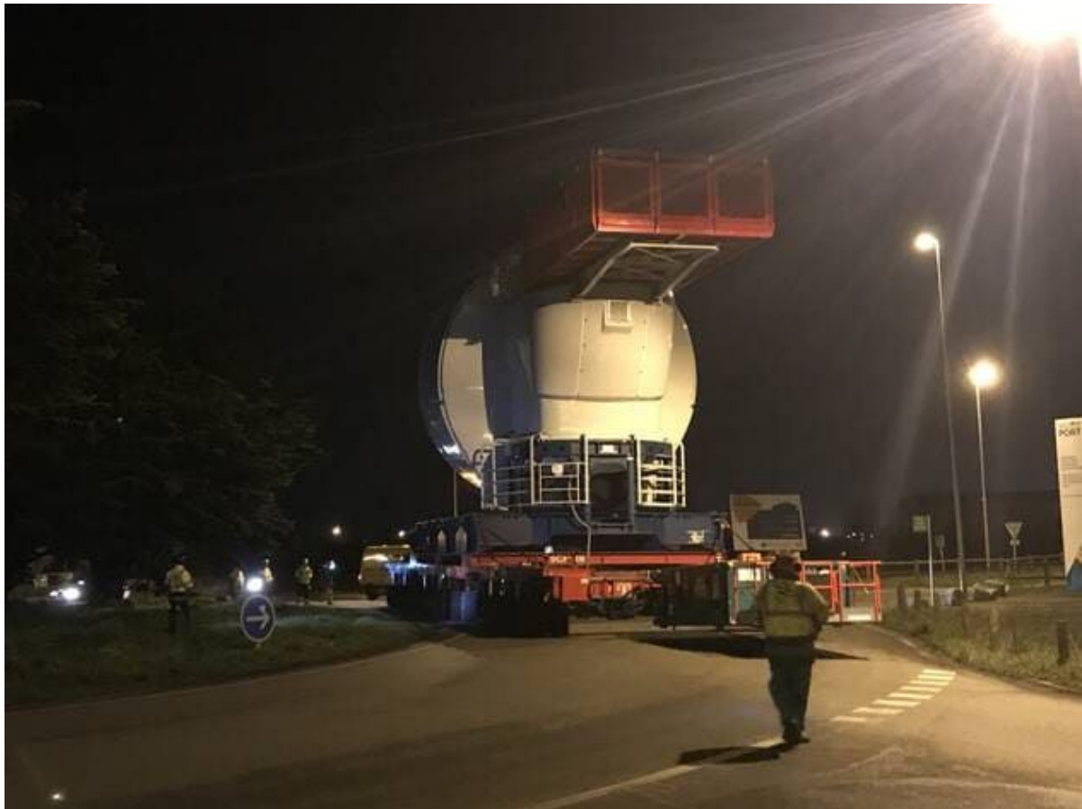
Cette nacelle N° 1 du futur parc éolien de Saint-Nazaire a quitté l'usine de Montoir lundi soir pour rejoindre le hub de stockage de la forme Joubert.