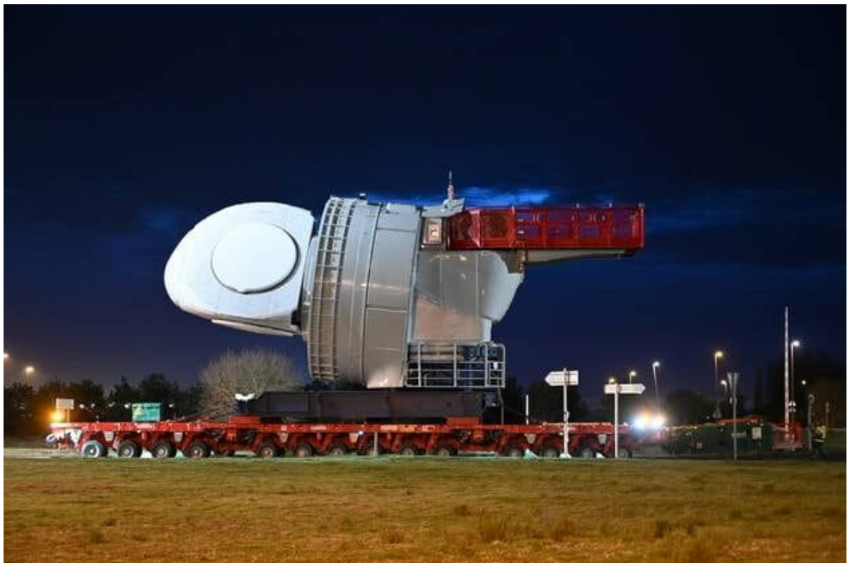
La lourde et imposante nacelle a mis plus de cinq heures à rejoindre le Hub éolien près de la forme Joubert. Les trajets suivants se feront en deux heures environ.