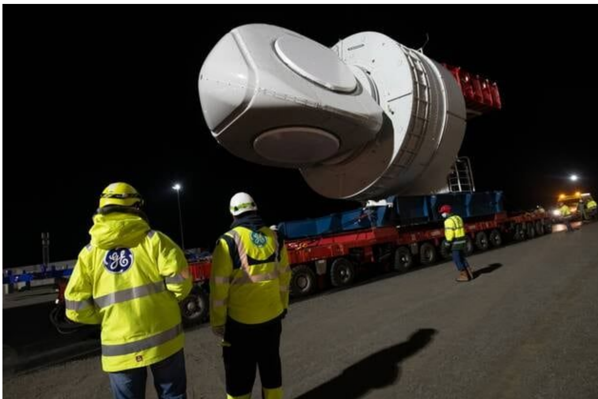
La lourde et imposante nacelle a mis plus de cinq heures à rejoindre le Hub éolien près de la forme Joubert. Les trajets suivants se feront en deux heures environ.