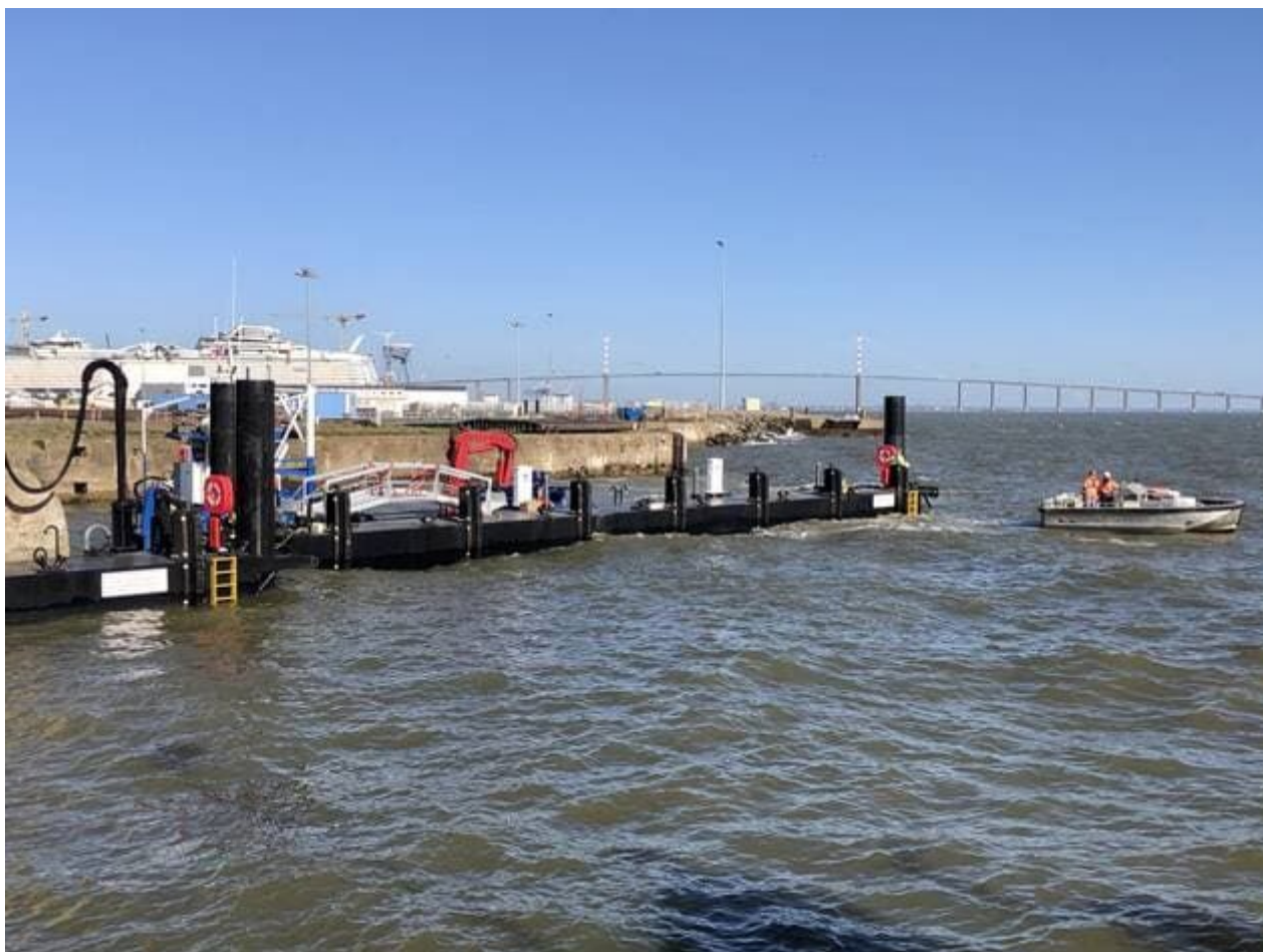
Les opérations d'installations se sont déroulées dans une mer formée.

C'est sur ces trois pontons que les salariés mobilisés au large sur la construction du parc éolien embarqueront et débarqueront chaque jour. La base de construction construite par EDF Renouvelables est ainsi le trait d'union entre le chantier en mer et la terre. Elle abrite en outre le centre de coordination maritime qui assurera une veille quotidienne sur les travaux et la navigation dans le périmètre d'implantation des 80 éoliennes.