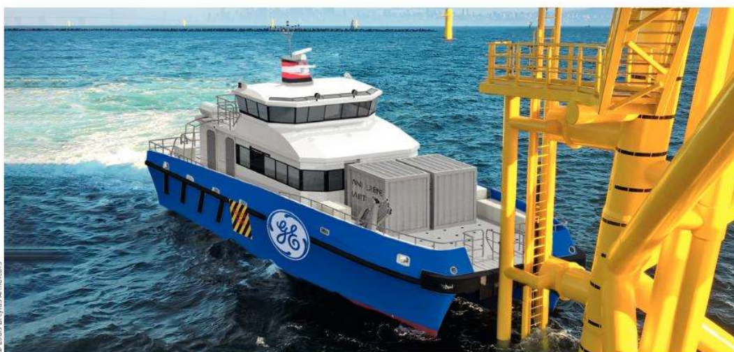
Les crew transfer vessels permettent de déposer et de récupérer le personnel travaillant sur les éoliennes.

Les CTV sont spécialement conçus pour débarquer et embarquer hommes et matériel, voire civière ou harnais descendus de la plateforme par une grue potence équipant chaque plateforme. Le principe du CTV – le plus souvent un catamaran (deux coques) – est que son avant, ceinturé par de très gros boudins en caoutchouc, s'immobilise en s'appuyant moteurs en avant pleins gaz contre deux gros tubes verticaux situés de part et d'autre de l'échelle, que vont agripper les techniciens. Trois de ces navires ont été conçus pour le parc de Saint-Nazaire par le cabinet d'architecture navale Mauric, pour le compte de Louis Dreyfus Armateurs. Ils ont des étraves étrangement fines pour des navires de ce type afin de limiter la flottabilité à l'avant, et donc les mouvements ascendants du nez du bateau lors des débarquements ou embarquements du personnel. Pour compenser ce qui pourrait devenir une insuffisance de flottabilité quand le bateau fait route et assurer du confort aux passagers, un foil a été rajouté en dessous, comme sur les voiliers de course ! Il est destiné à soulever le nez du bateau quand il accélère et à limiter les mouvements verticaux de l'avant (tangage).