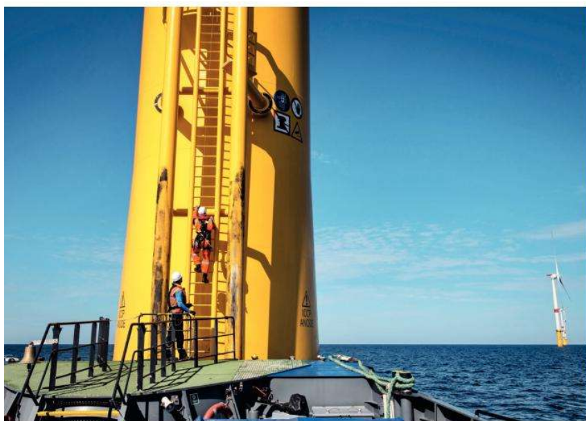
Les éoliennes de Saint-Nazaire sont « monopieux ». Elles sont directement fixées au fond de l'eau.

De la terrasse du bâtiment qui abrite aussi stocks et ateliers, on aperçoit distinctement la frise des éoliennes au large. Elles se trouvent pourtant à une dizaine de milles et nous allons mettre une heure pour les atteindre en bateau. Une fois au milieu du parc, le nombre impressionne plus que les dimensions. On sait que le sommet des pales culmine à plus de 200 mètres (deux tiers de la tour Eiffel), que la plateforme où les équipes d'entretien trouvent la porte d'entrée dans les mâts est à environ 35 mètres au-dessus de l'eau (un immeuble de dix étages). Mais comme on ne s'approche pas trop près, on se sent moins intimidé qu'au pied de certains phares sur des caps ou rochers escarpés. On s'imagine manœuvrer un bateau sans problème entre deux machines. C'est plus l'alignement qui impressionne : au minimum cinq engins à dépasser sur 5 kilomètres si on traverse au plus court, jusqu'à une quinzaine de machines sur 15 kilomètres si on a besoin de passer dans le sens est-ouest. On doit se sentir bien petit si on a le moindre problème au milieu.