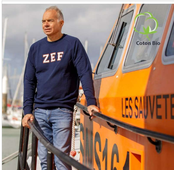
SWEAT ZEF ADULTE