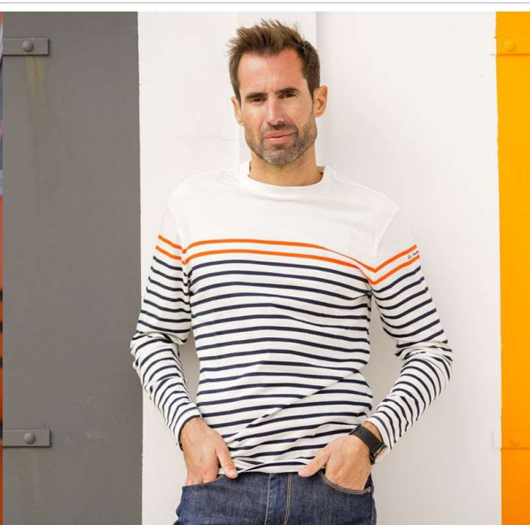
T-SHIRT RAYÉ MANCHES LONGUES ADULTE