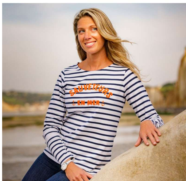
MARINIÈRE CAPOCÉAN FEMME