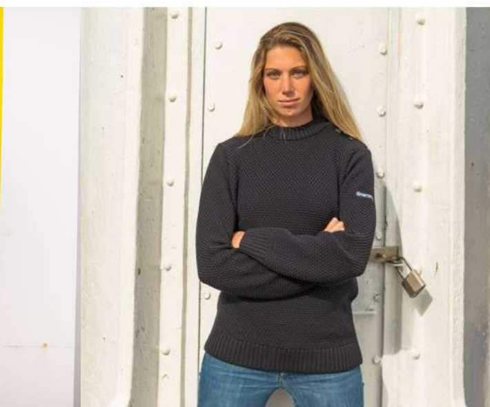
PULL CAEN SAINT JAMES