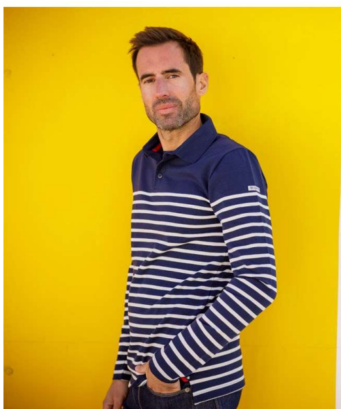
POLO RAYÉ MARINE MANCHES LONGUES