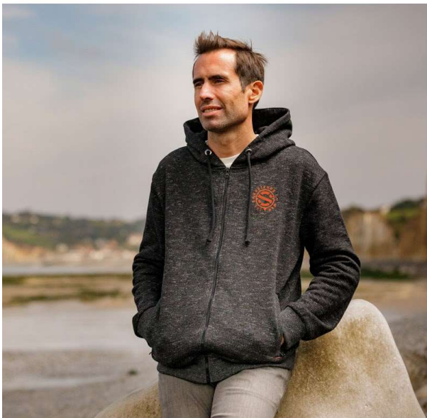
SWEAT ZIPPÉ NOIR CHINÉ HOMME