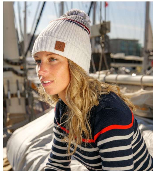
BONNET LESPI BLANC