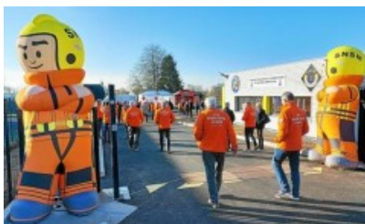
Les mascottes ouvrent le CFI de Quimper - Cornouaille