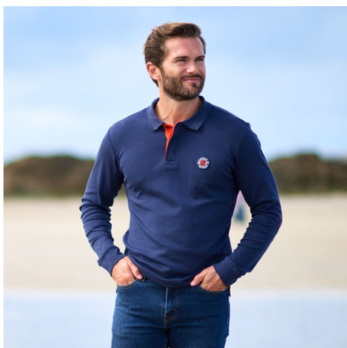
POLO STADE MANCHES LONGUES

Soutenez les Sauveteurs en Mer en achetant solidaire !