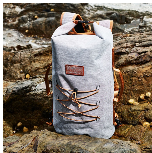
SAC À DOS ÉTANCHE SNSM X ZULUPACK