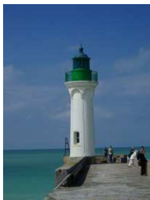
Le phare de Saint-Valery-en-Caux

L'APPL Manche- Mer du Nord, s'engage dans une action de promotion, d'information et d'animation à l'heure où nos plaisanciers attendent autant des plaisirs de la mer que du dépaysement d'un séjour ou d'une escale.